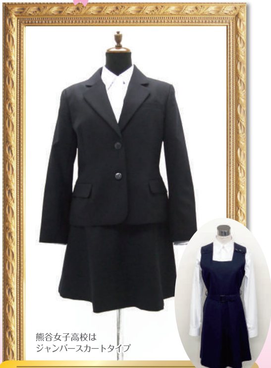
熊谷女子高校は ジャンパースカートタイプ